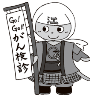
江津市健康づくりキャラクター けんしんごうくん

かると言われています。毎日の生活習慣の中でできる「がん予防」と、症状がないうちにがんを早く見つける「がん検診」の両方で、健康管理に努めましょう。