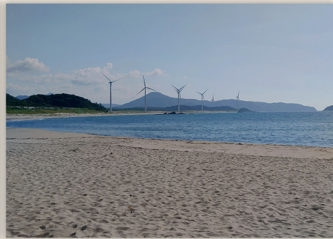
底干の浦・黒松漁港