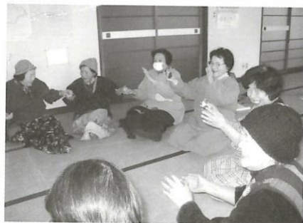
上大賀「ふれあいサロン」