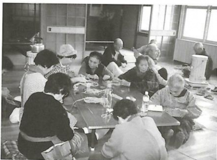
田津「ふれあいサロン」