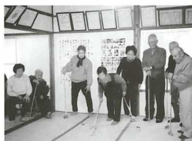
下大賀 さざん花の会「ふれあいサロン」