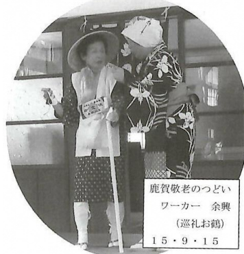
鹿賀 おたのしみ会「ふれあいサロン」