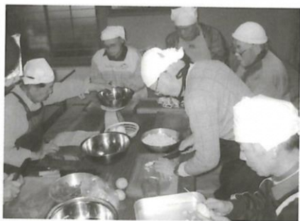
渡 なごやか会「ふれあいサロン」