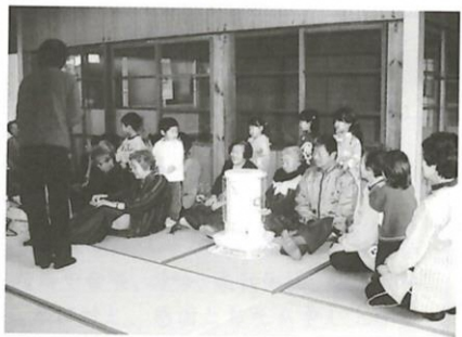
渡田「ふれあいサロン」