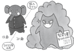
島根県消費者センターマスコットキャラクター だまされないゾウくん