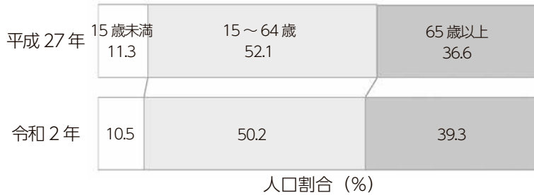
(図) 本市の年齢(3区分)別人口割合の推移