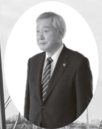
江津市長 山下 修

安心で安全なまちづくりと、持続可能な市政運営に向けて、職員一丸となって、必要な施策を迅速、且つ、着実に遂行する所存です。そのうえで、ニューノーマルとも呼ばれる新しい社会にあさわしい、小さくともキラリと光るまちごうつの実現に向け、今後も力を尽くしてまいります。本年も変わらぬご支援、ご協力をよろしくお願い申し上げます。