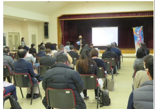
△企業ガイダンスの様子 (令和3年3月4日 会場：地場産業振興センター)