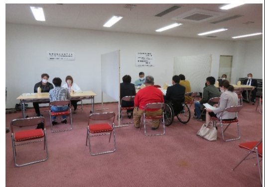
△ミニ企業ガイダンスの様子 (令和2年11月18日 会場：地場産業振興センター)