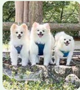
大福・笑瓶・こむぎ