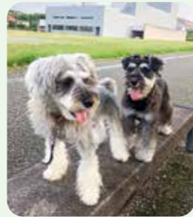
ちゃちゃまる・じじまる