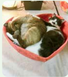
ぶんちゃん・ちょびちゃん