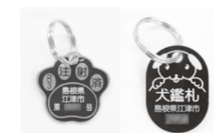
④犬の鑑札 ⑤狂犬病予防注射済票