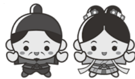
江津市PRキャラクター 「人麻呂くんとよさみ姫」