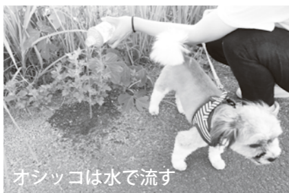
オシッコは水で流す