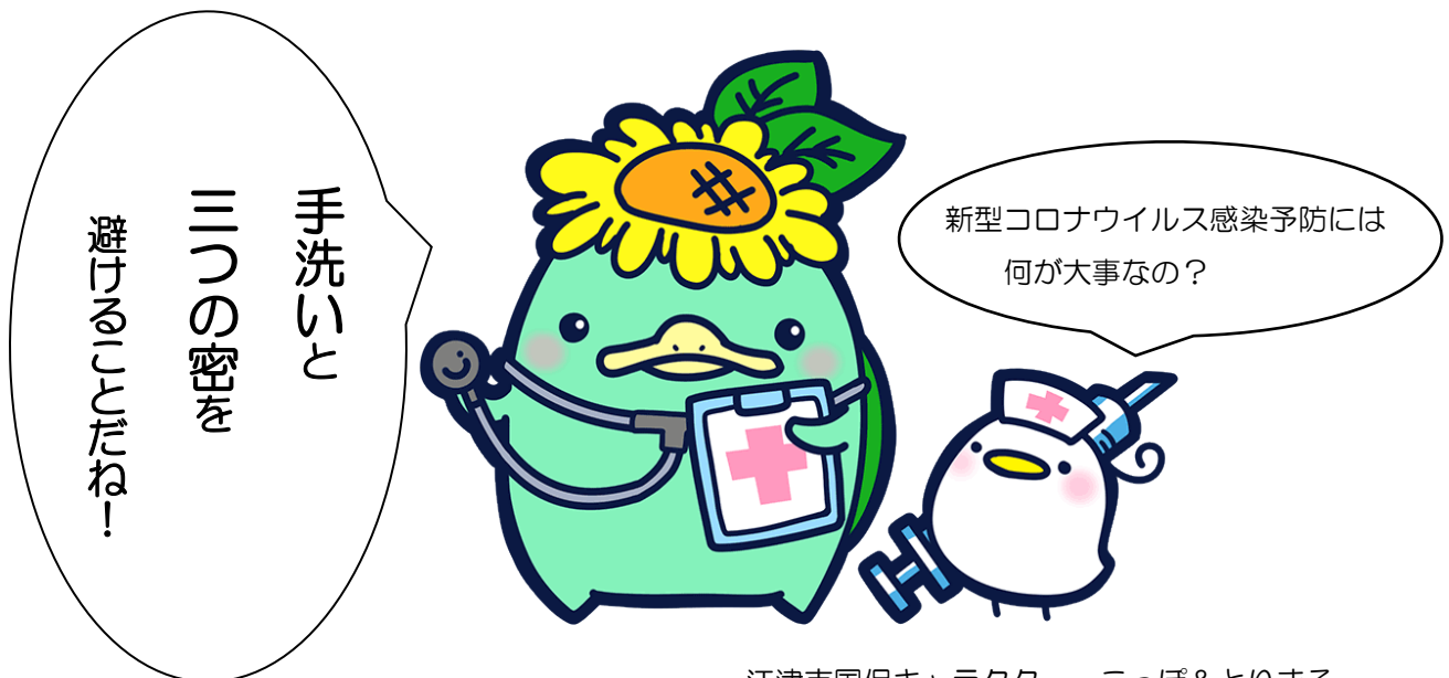
江津市国保キャラクター こっぼ&とりまる

国保の医療費はみなさまの保険料と国等の負担で成り立っています。江津市の医療費は高止まりしており、これ以上医療費を増やさないように、みなさんの健康づくりを推進するための保健事業も国保の大切な仕事です。