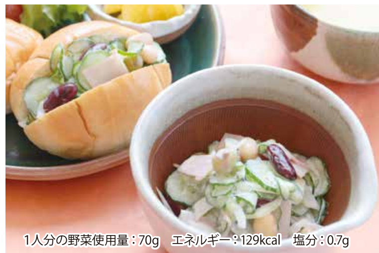
1人分の野菜使用量：70g エネルギー：129kcal 塩分：0.7g