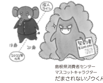
島根県消費者センター マスコットキャラクター だまされんぞうくん