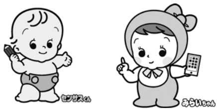
図 政策企画課統計管理係 TEL(52) 7928