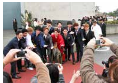
※写真は令和2年成人式の様子