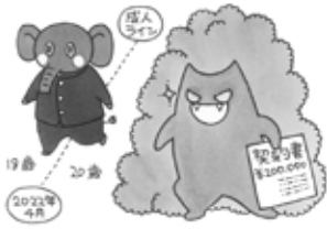
島根県消費者センター マスコットキャラクター だまされないゾウくん