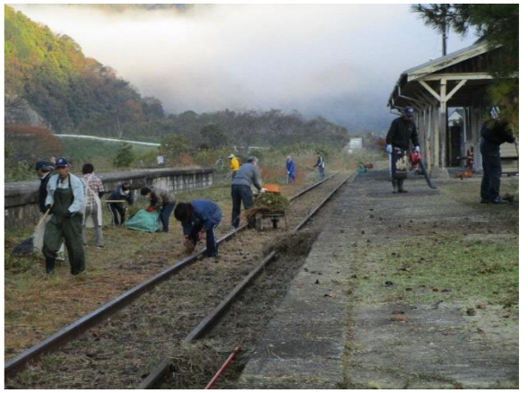
旧川戸駅の草刈り実施

防災説明会が開催されました 11月15日、国土交通省と江津市の主催で、「江の川下流域における今後の洪水対策方針（案）」の説明会が開催されました。 会議の中では、これまで進めてきた堤防工事等の河川改修による防災に加えて、集落の嵩上げや集落移転などによる洪水対策の対応方針が示されました。 出席された下流域の住民からは、早期の堤防工事完成や、ダムの洪水対策などの意見が出されました。