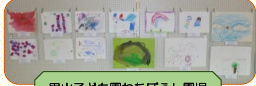
里山子ども園わたぼうし園児