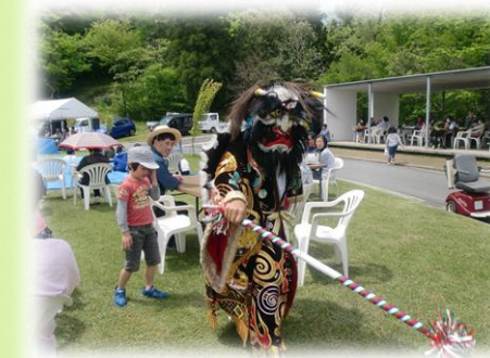
※写真は昨年のものです