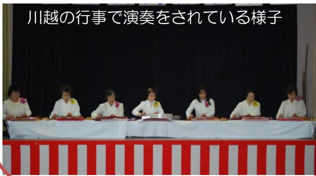
川越の行事で演奏をされている様子

〜大正琴の会〜 会員 9名 毎月第3土曜日 練習場所: 交流センター 会費 1回500円 一緒に演奏♪してみませんか? お問合せ先: 交流センター(☎93-0825)