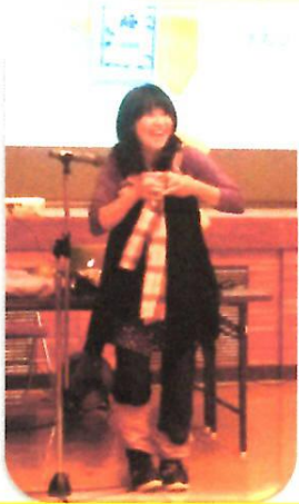
「おんぶひも」の実演！