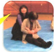
ちょっとしたコツで、簡単に起こせます！

昔の「おんぶひも」がどんなに優れているか…私たちが、常識？だと思っていたことが住環境の変化によって変更されていることや、【毎日のカバンを防災仕様にするというアイデア】など、これからの地域を担っていく若い世代、若いお父さんやお母さん、とりわけ中学生や高校生に是非受けていただきたい講演でした。