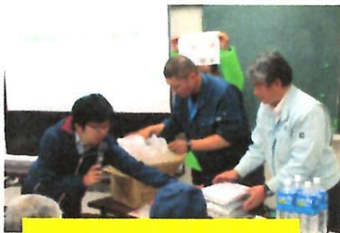
防災食作りに初挑戦！