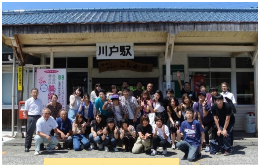
最終日！出発前に全員で記念撮影