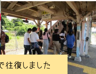
川戸・江津間を三江線で往復しました