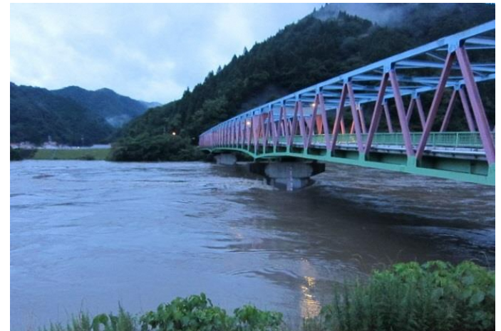
47 災害に匹敵する水位となった江の川(桜江大橋) 川戸側から谷住郷を望む

江の川により出口をふさがれた八戸川の氾水が拡がる！ 歩み橋方面から八戸川、小田、月の夜を見る。