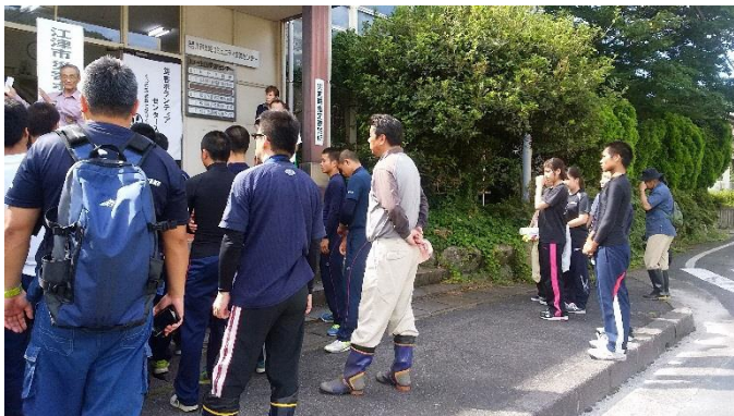
早朝から駆けつけてくださったボランティアの皆さん

7月11日(水)に旧、川戸交流センターに江津市社会福祉協議会により、江津市災害ボランティアセンターが開設されました。初日から大勢のボランティアの方が酷暑の中を我が身をいとわず、一生懸命に水に濡れた家具の搬出など手伝っていただきました。