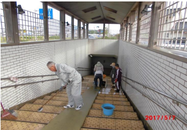
地下歩道の定期清掃