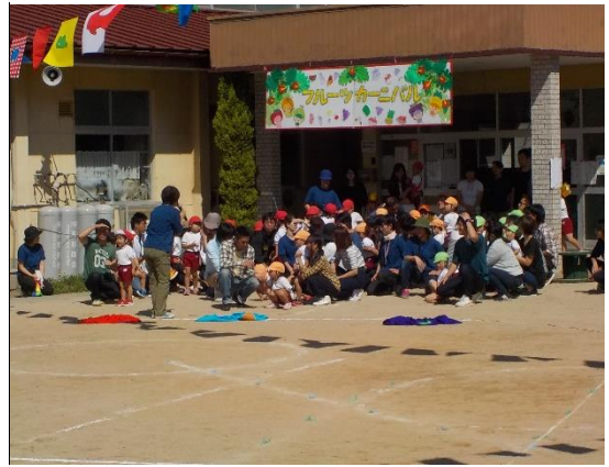
お父さんのデカパン目指して