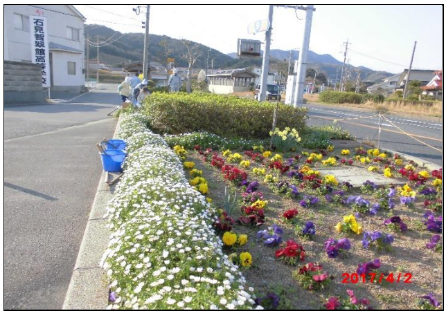
新旧9号線の交差点花壇整備