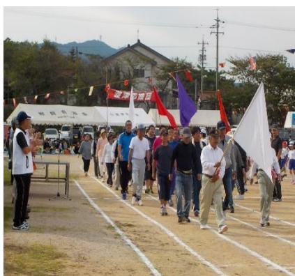
優勝した嘉戸チーム入場行進