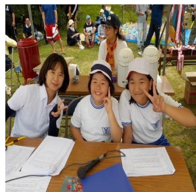
場内放送良かったよ