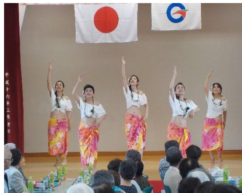
セニョール・ツバキ熱演 子供たちと3B体操の「おねーさん」 おへそが可愛いタヒチアン