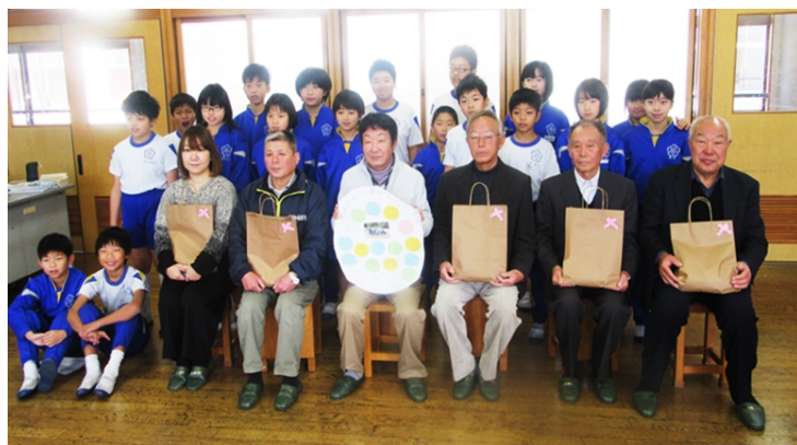
5年生の皆さん、ありがとうございます。