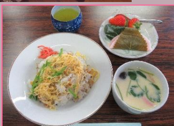
【献立】チラシ寿司、茶わん蒸し、桜餅、くだもの

会食では、給食ボランティアさんによる春の季節にぴったりの美味しい食事に、会話も弾みました。