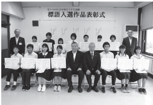
↑10月2日、「社会を明るくする運動」標語入選作品の表彰式を市役所で行いました。