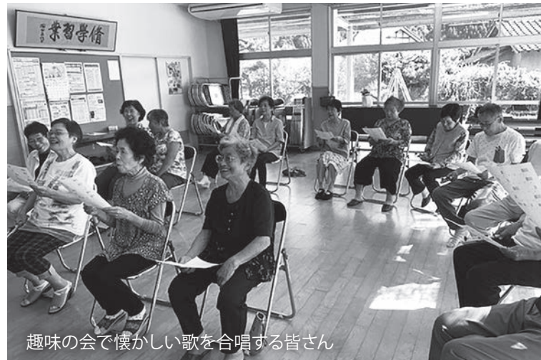
趣味の会で懐かしい歌を合唱する皆さん

年 を重ねるにつれて、身体とこころの働きが低下し、要介護に至る危険性が高まった状態のことを「フレイル（虚弱・機能低下）」と言います。フレイルは、健康から要介護状態に移行する中間の段階に位置付けられます。フレイルに陥るきっかけは、社会とのつながりを失うことだと考えられています。いつまでも元気に過ごすためには、身近な人と声を掛け合って地域の集まりの場に参加することが大切です。 波積地区では、波積地域コミュニティ交流センターでさまざまな活動を行っています。 今回は、地域の人が集まるサロン「はしまの場」と演奏会や遊びなどが楽しめる「趣味の会」について紹介します。