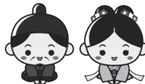
江津市 PR キャラクター 「人麻呂くんとよさみ姫」