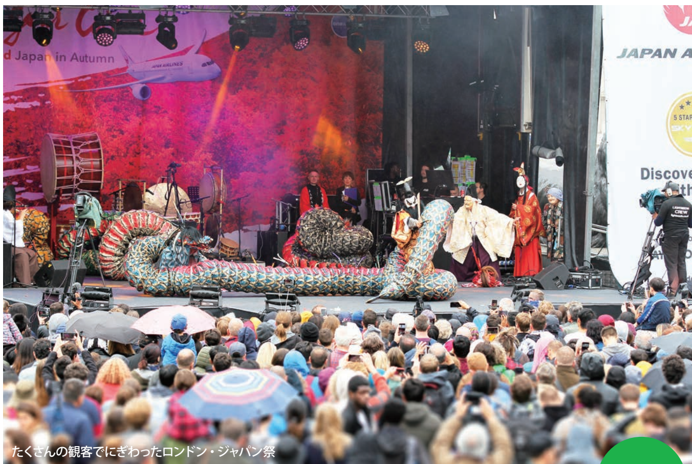
たくさんの観客でにぎわったロンドン・ジャパン祭