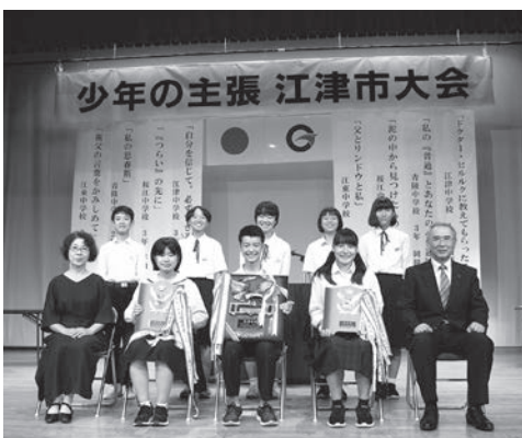
↑少年の主張江津市大会で発表した生徒たち