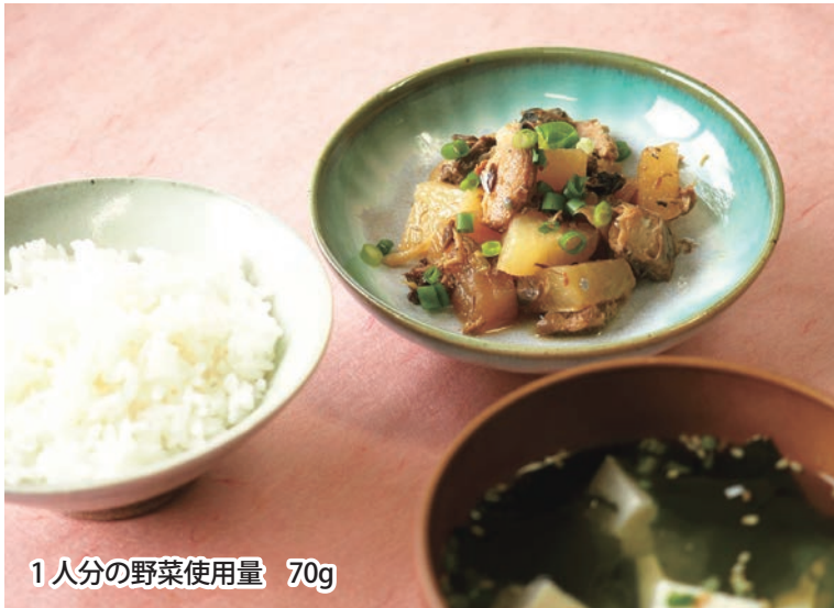
1人分の野菜使用量 70g