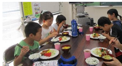
皆で、おいしいお昼タイム!!

今年は、保護者の参加は1名でしたが事業の反省の席で「今後は、保護者の方の参加をもっと促してみよう」との意見が出されました。