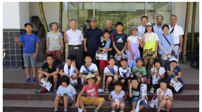
今井美術館まで、みんなで歩いて「フィギュア展」を見に行きました