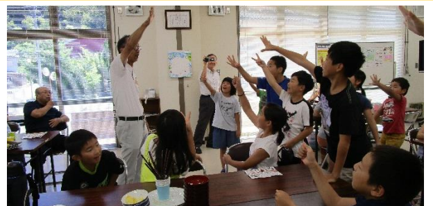
デザートのおいしくクリームは、今田協議会会長を相手にジャンケンで!! 真剣勝負!!

今年は、保護者の参加は1名でしたが事業の反省の席で「今後は、保護者の方の参加をもっと促してみよう」との意見が出されました。