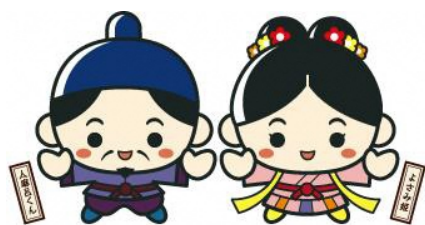
江津市PRキャラクター 人麻呂くん♡よさみ姫

この調査は、大地震のリスク、待機児童率、治安、駅・バス停までの距離など暮らしやすさを貨幣価値に換算した調査結果です。