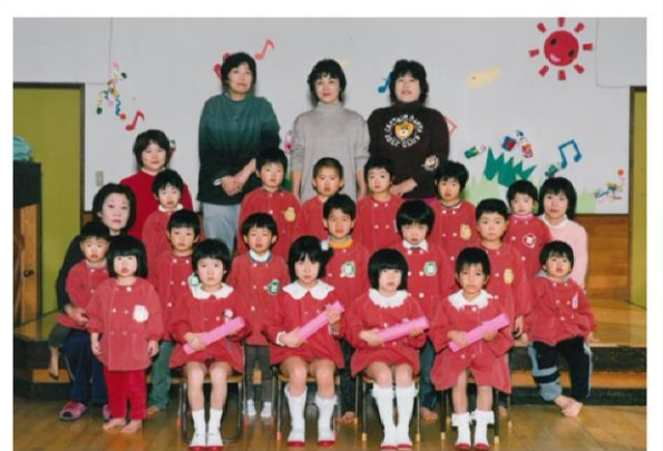
平成 14 年度卒園児・修了児 (平成 15 年 3 月卒園)