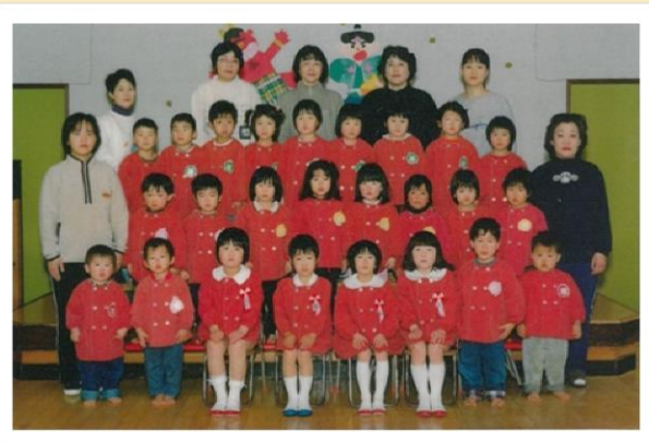
平成 12 年度卒園児・修了児 (平成 13 年 3 月卒園)