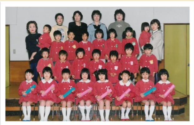
平成 13 年度卒園児・修了児 (平成 14 年 3 月卒園)