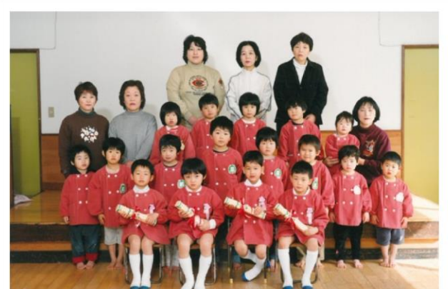
平成 15 年度卒園児・修了児 (平成 16 年 3 月卒園)