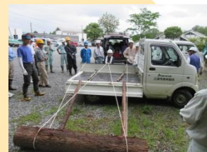
ロープを使って軽トラックへ積み込み