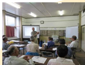
座学・ロープワーク