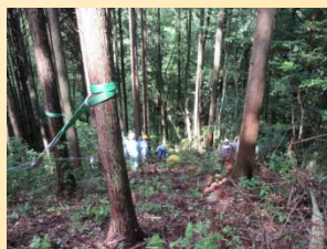
PCウインチを用いて山での搬出作業