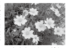
オオキンケイギク

6月～7月頃に鮮やかな黄色の花をつけるオオキンケイギクは、市内でもよく見かけますが、