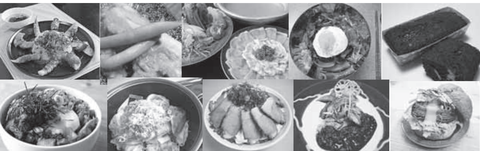
「つろ〜て江津食フェア」で食べることができる、各店舗の料理