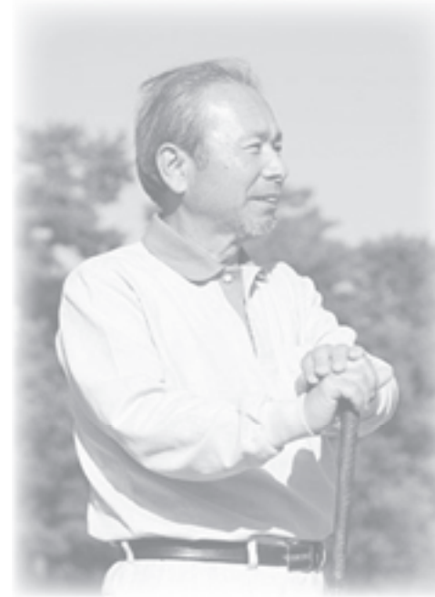
健康であるためには、病気になることが一番です。そのためにも検診を受けてください。

● 検診を無料で受けられます！ 国民健康保険加入者は、各種がん検診の自己負担を国保が助成していますので無料です。詳しくは、「健康づくり予定表」をご覧ください。