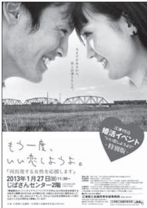
江津YEG婚活イベント “いい恋しようよ!!”の特別版