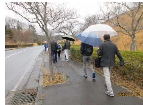
坂道はしんどいねー

3月15日(土)長谷健康づくり推進会主催により、健康づくりハイキングを開催しました。 当日はあいにくの小雨でしたが、みんな頑張って歩きました。19名の参加でした。 コースは、風の国の駐車場を出発して、風の池を横目に風の原を散策し、風の国グランドゴルフ場横から断崖を眺めつつ山中郷に下り、駐車場へとおよそ2.7kmの道のりを、1時間かけて歩きました。 参加いただきました皆さんご苦労様でした。 またの機会にも多くの方のご参加をお願いします。