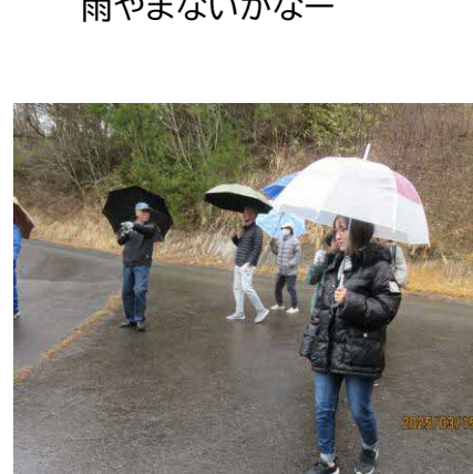
雨やまないかなー