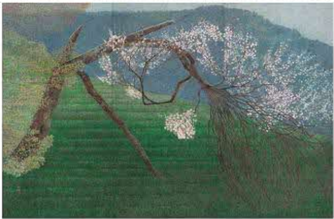
「藤原 経光」の「大木」(複製) / 京都府立総合資料館蔵

The 108th Exhibition of the Japan Art Institute