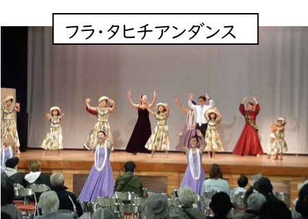
フラ・タヒチアンダンス