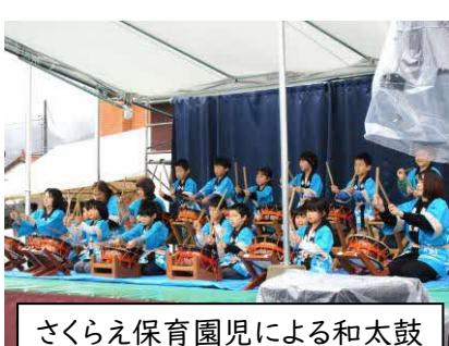
さくらえ保育園児による和太鼓