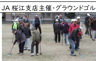
JA 桜江支店主催・グラウンドゴルフ大会