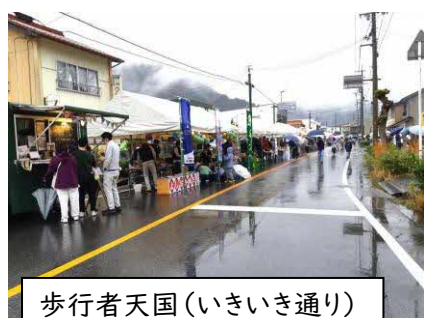
歩行者天国(いきいき通り)

昨年同様天候に恵まれず、ステージイベントは途中から総合センター大ホールへ変更となりました。イベントステージでは、さくらえ保育園児による和太鼓や桜江中学校吹奏楽の演奏、石見智翠館高校吹奏楽コンサートなど盛り沢山の内容でした。最後のよさこい踊りや総踊りでは桜江の子供達も参加し、盛会のうちに終了しました。歩行者天国のいきいき通りでは31店が出店しました。当日は気温も低くなり、温かい飲食物が盛況でした。