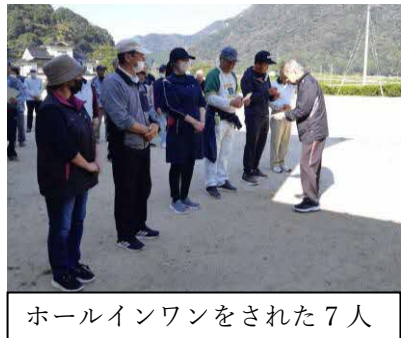
ホールインワンをされた7人には賞品が渡されました

川越地区人口 (R5.10月末現在) 男性 211人(-1) 女性 238人(-2) 計 449人(-3) 世帯数 247(-3) 65歳以上人口 男性 111人(±0) 女性 134人(-2) 計 245人(-2) 高齢化率 54.57%