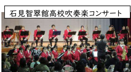
石見智翠館高校吹奏楽コンサート