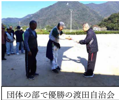
団体の部で優勝の渡田自治会