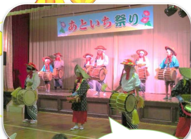
オープニングは 田植えばやし保存会