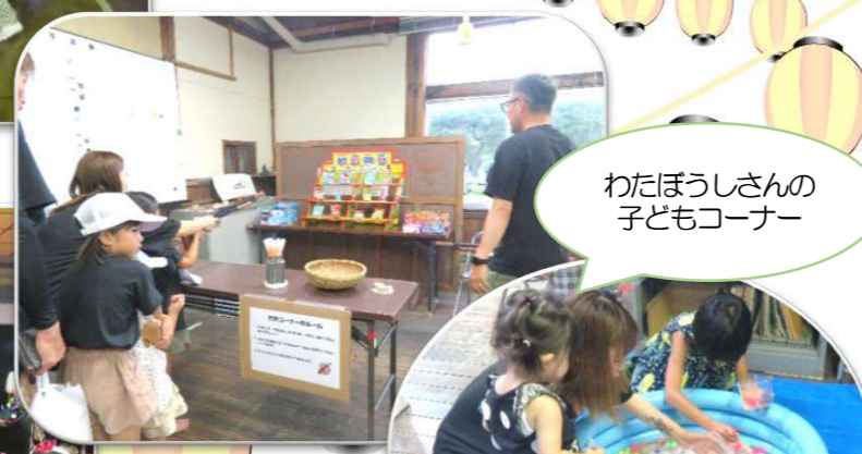
わたぼうしさんの 子どもコーナー