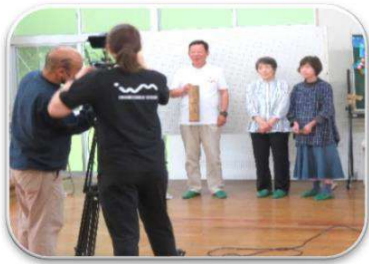
6月25日の「AITAB」に向けて、石見ケーブルTVでの宣伝用放送のビデオ撮りがありました。

跡市近辺でも、熊が確認されています。熊は、鋭い歯と爪を持っています。早朝、夜間は特に注意しましょう。また、自分の存在を知らせる鈴などを携帯することも大事です。