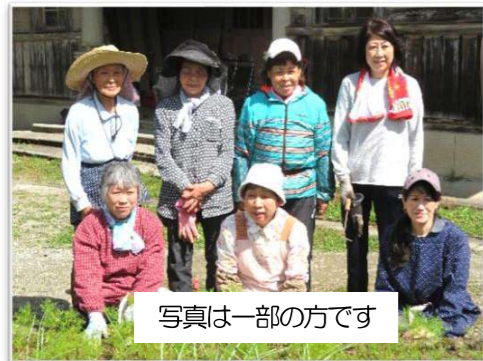
写真は一部の方です