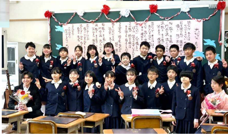
卒園生6名【市山地区2名】