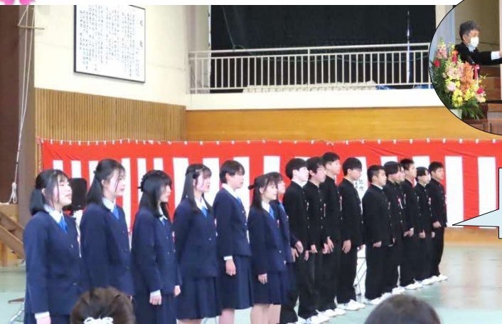
中学校卒業生19名 【市山地区6名】