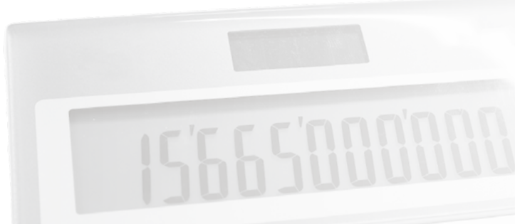
令和5年度一般会計の歳出 ※（ ）内の数字は構成比

ている有福温泉の再生に引き続き取り組みます。 また、自治体業務が更に増大・複雑化する中、「スマートシティ江津推進構想」に基づく業務効率化、各施策・事業の費用対効果の検証・精査を行い、持続可能な行政運営を実現するための取り組みを進めます。