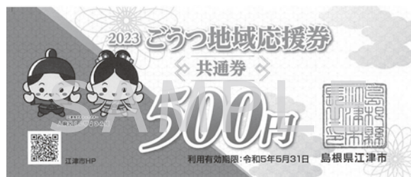
▲ごうつ地域応援券共通券（実際の券は緑色です）