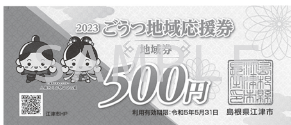
▲ごうつ地域応援券地域券（実際の券はオレンジ色です）