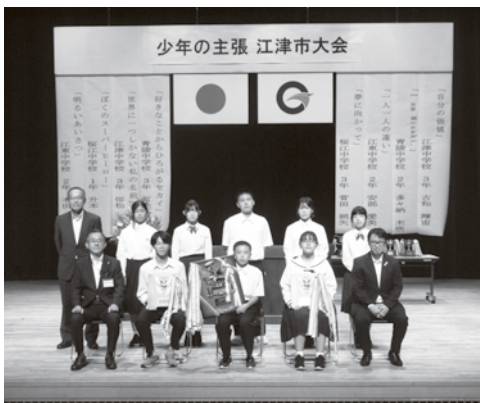
↑少年の主張江津市大会で発表した生徒たち