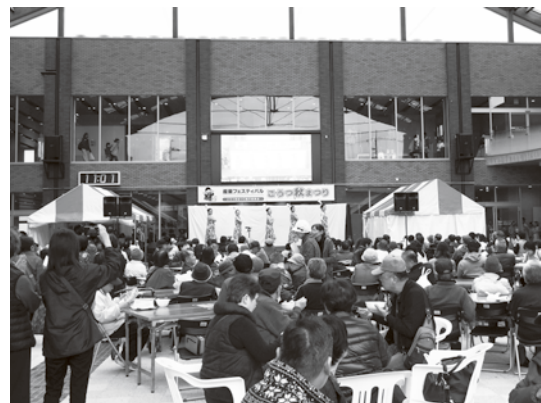
↑令和元年開催のごうつ秋まつりの様子