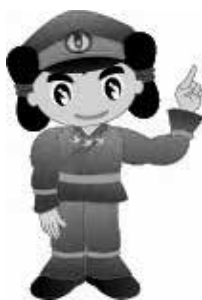
島根県警察シンボルマスコット 「みこぴーくん」