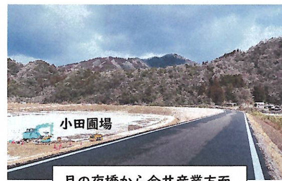
月の夜橋から今井産業方面

一級河川江の川水系八戸川河川等災害関連事業として進められてきた八戸川の堤防工事のうち、小田圃場側と月の夜側の堤防が完成しました。下図の市道川戸長尾線・山手月の夜線は舗装工事も終わり、車輛・歩行者ともに通行できます。なお、月の夜・三田地間は避難路設置工事のため、引き続き通行止めです。市道川戸長尾線は2年連続で中止になっている新春走り初めのコースです。来年は新しくなった堤防の上を走る光景が楽しみです。