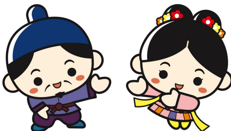
江津市PRキャラクター 人麻呂くん♡よさみ姫