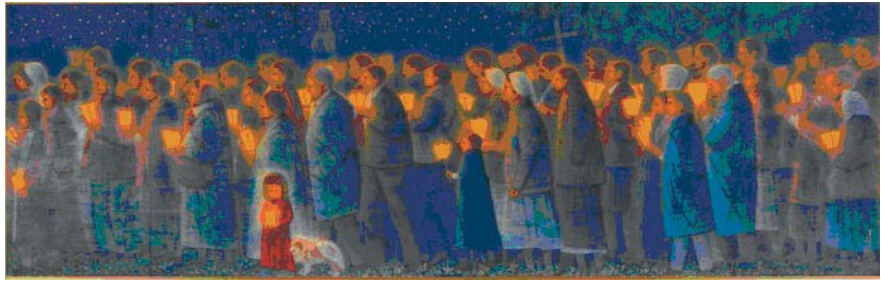
平山郁夫「祈りの行進・聖地ルルド・フランス」